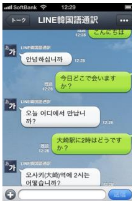
日本語メッセージを自動翻訳

LINE の「友だち」リストに任意の通訳アカウントを追加すると、自動メッセージでガイダンスを表示します。