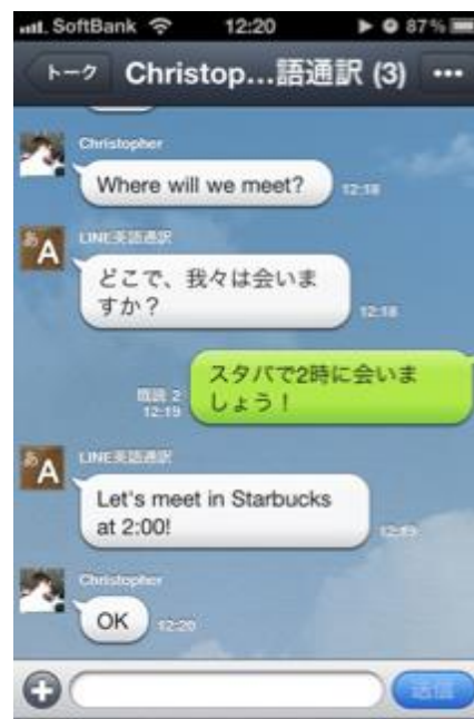
複数人での会話も可能

通訳アカウントに対して日本語でメッセージを送信すると、自動翻訳をして返信いたします。